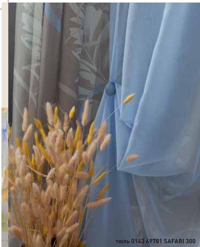
тюль 0143 49781 SAFARI 300