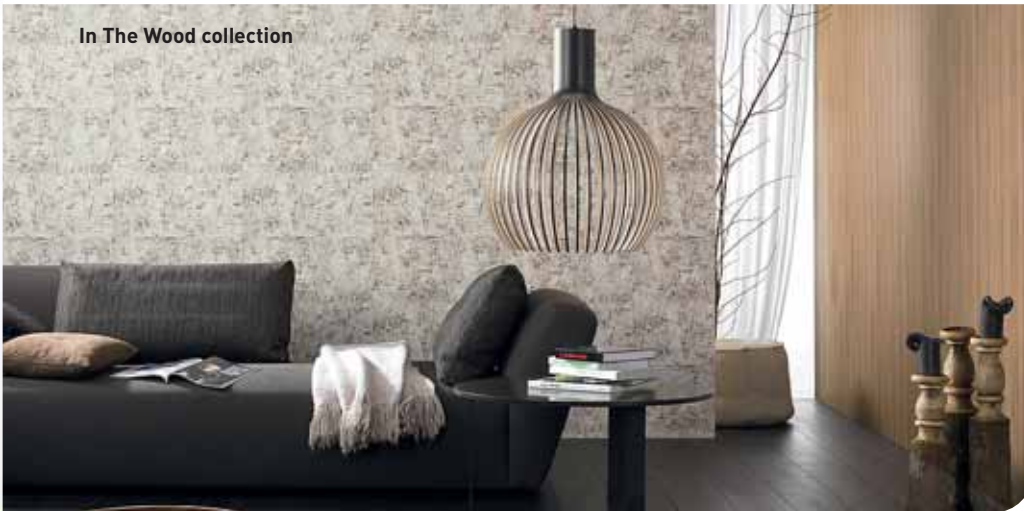
In The Wood collection

Спокойная цветовая гамма и декоративные поверхности, имитирующие структуру дерева и древесной коры, действуют умиротворяющее. Изысканными интерьерами с обоями из этой коллекции можно наслаждаться не спеша.