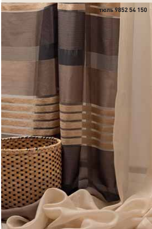
Тюль 9852 54 150