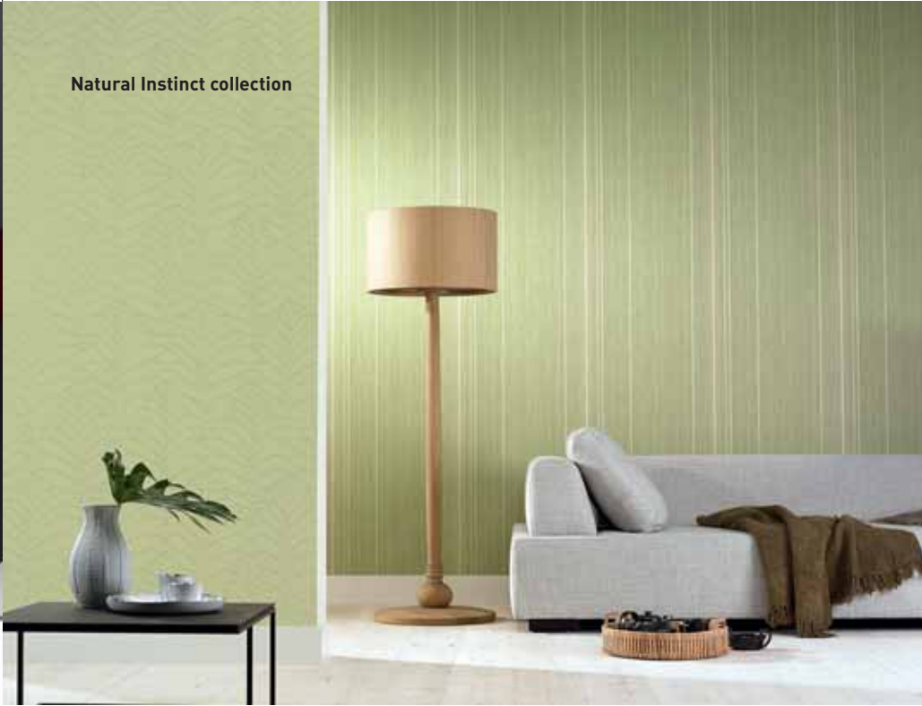
Natural Instinct collection