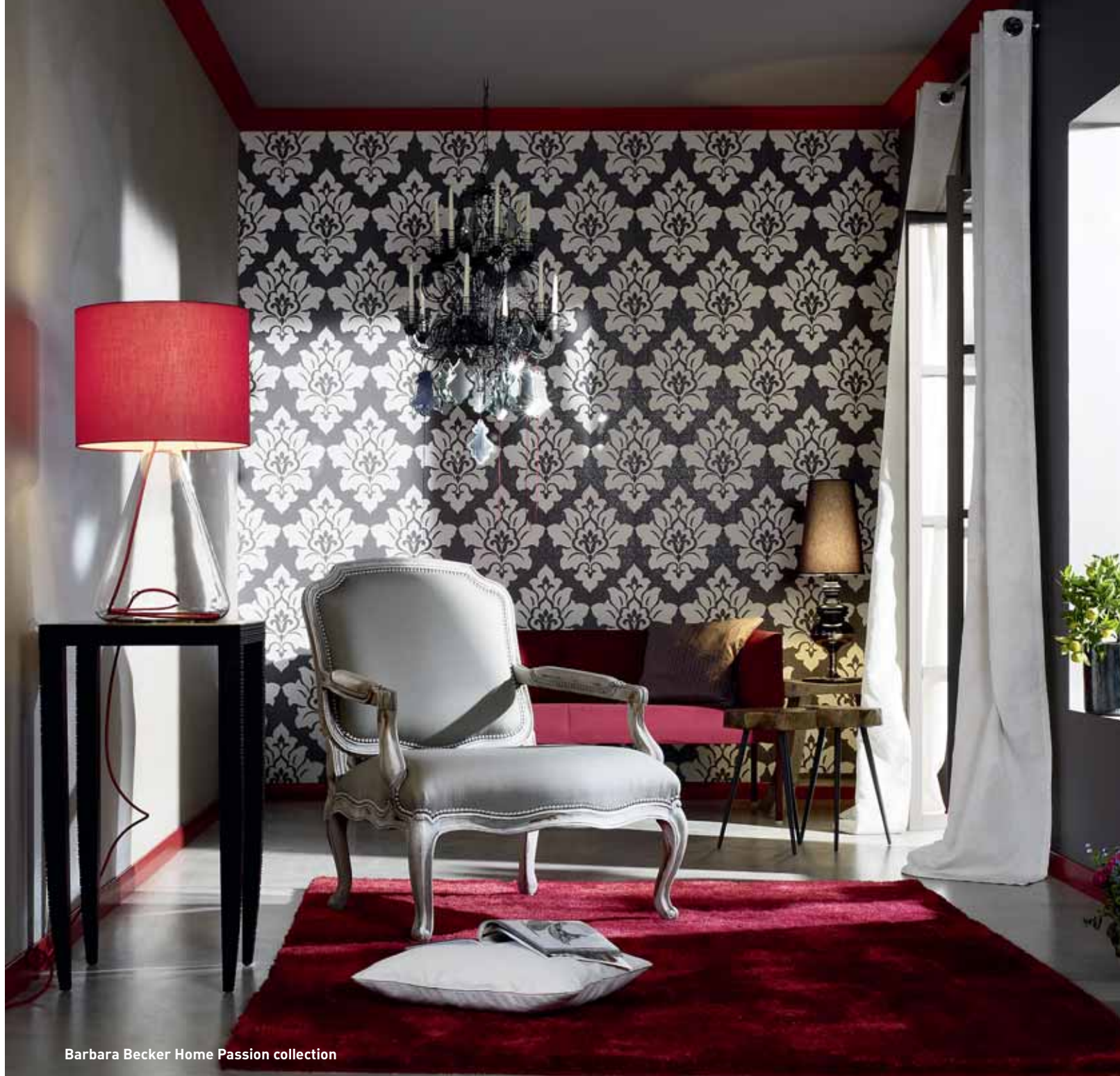
Barbara Becker Home Passion collection

Beautiful Temptation – симбиоз орнаментов в стиле барокко и интерьерных тенденций, популярных в 50-е годы прошлого века, преломленный сквозь призму современных трендов и по-новому интерпретированный, выглядят скромно и элегантно.