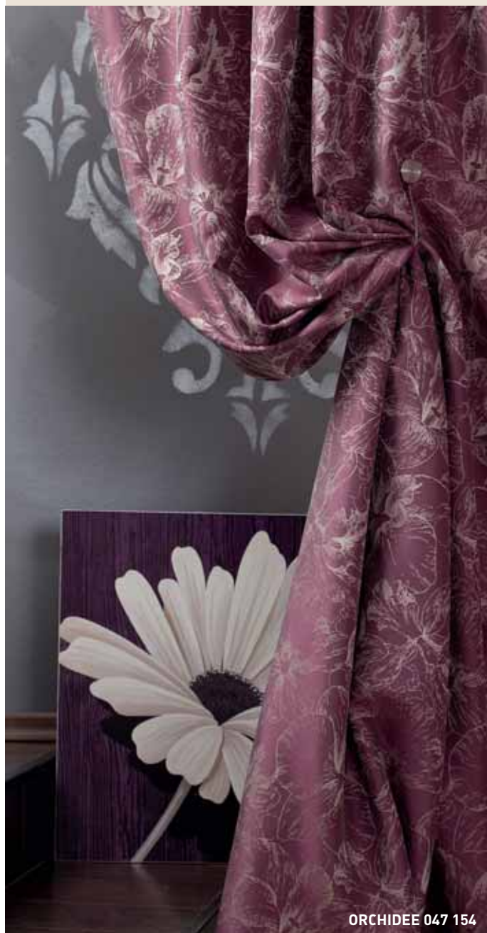
ORCHIDEE 047 154