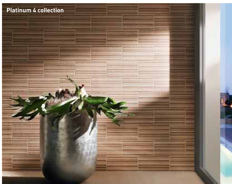
Platinum 4 collection

Выполненные из винила на флизелиновой основе обои удобны при наклеивании и долговечны в использовании, как всегда отличное немецкое качество.