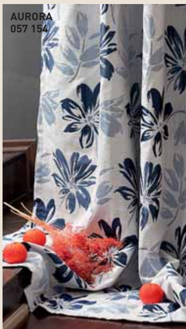
AURORA 057 154