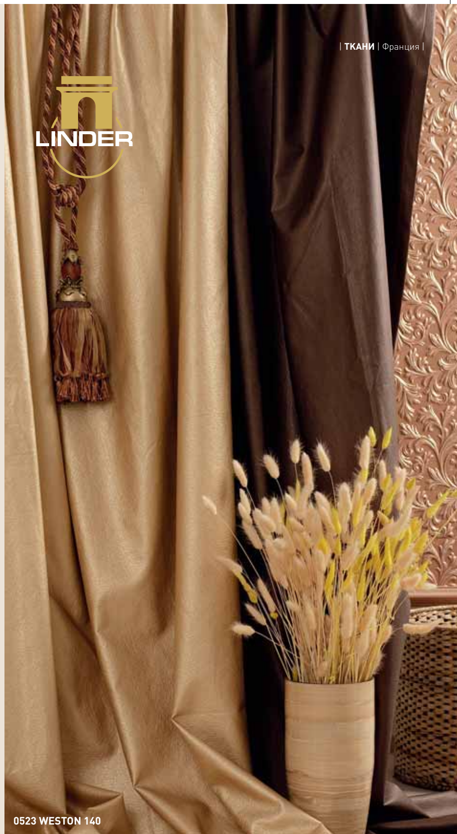
0523 WESTON 140