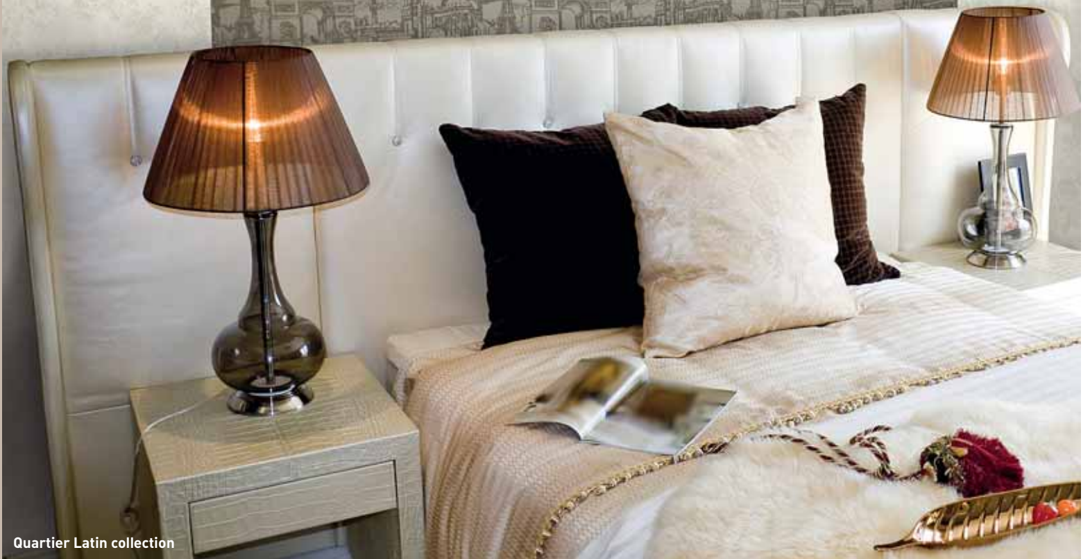
Quartier Latin collection