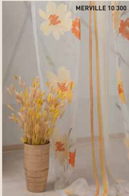
MERVILLE 10 300