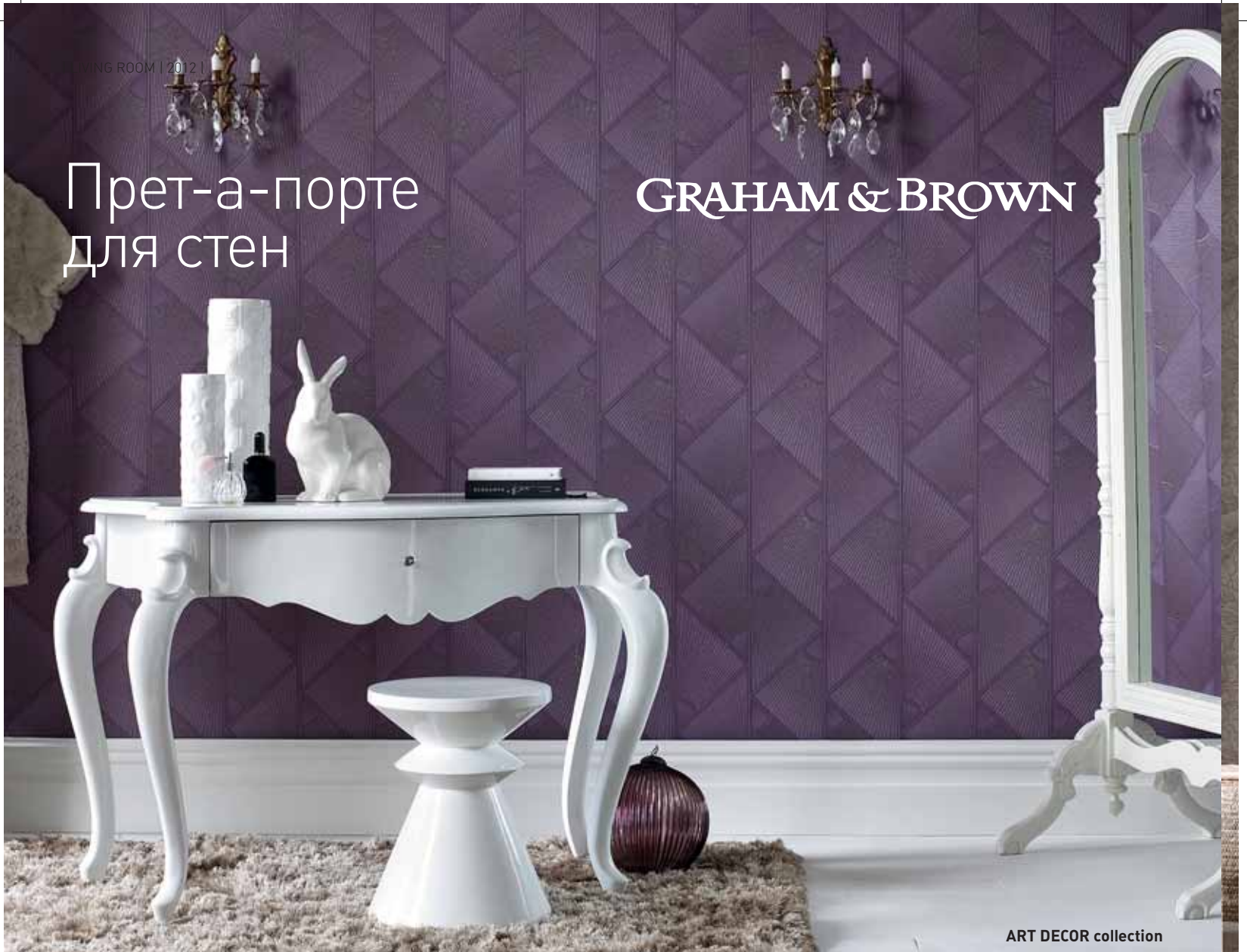
ART DECOR collection