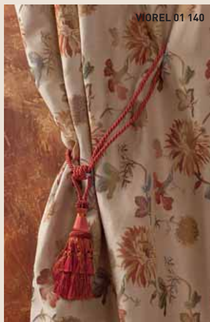
WOREL 01 140