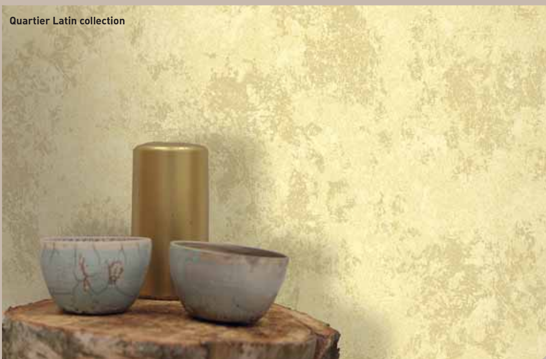
Quartier Latin collection