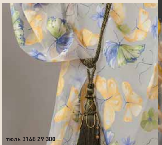
тюль 3148 29 300