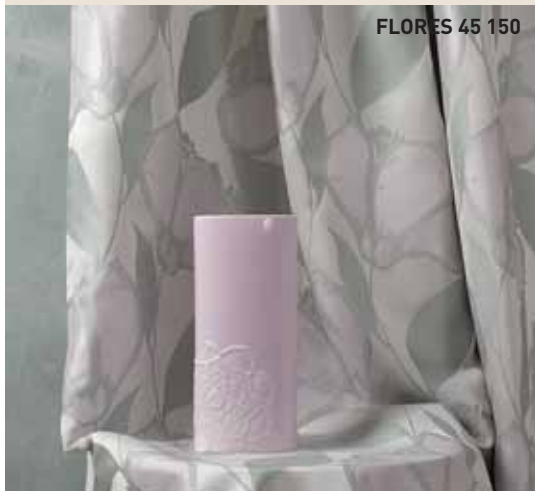
FLORES 45 150