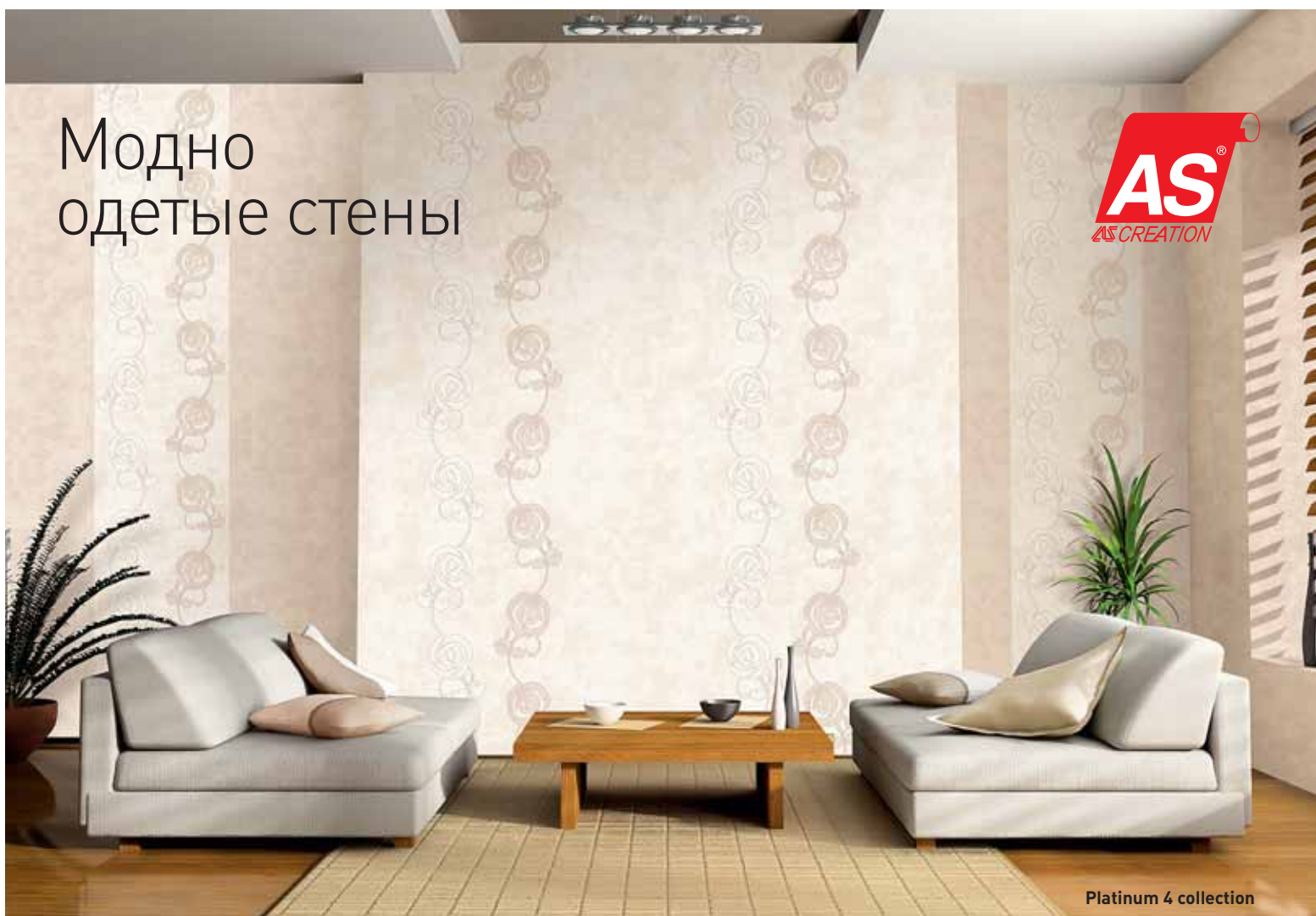
Platinum 4 collection