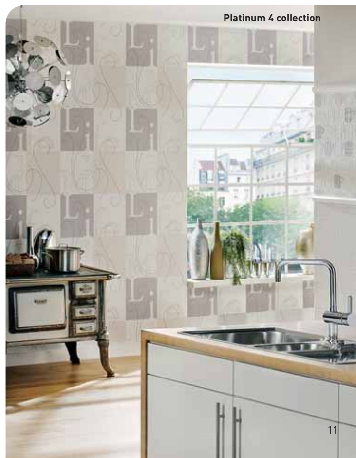
Platinum 4 collection