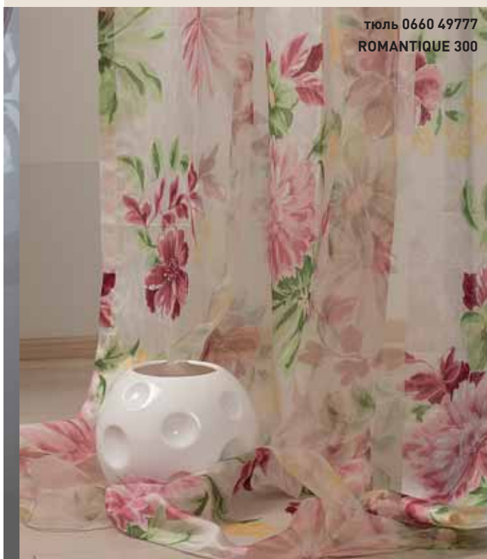
тюль 0660 49777 ROMANTIQUE 300