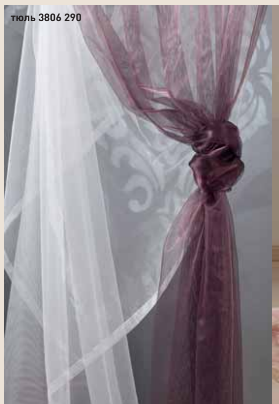
тюль 3806 290