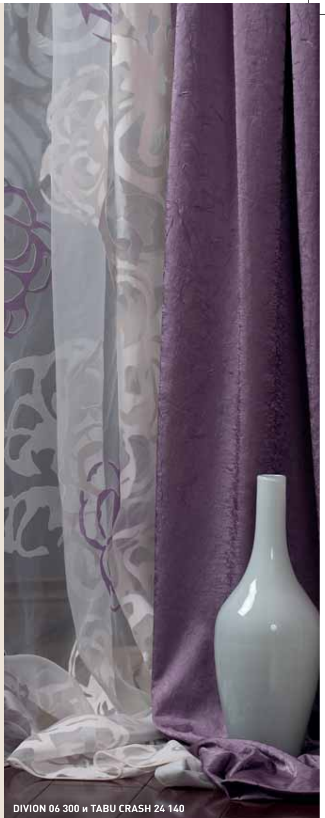
DIVION 06 300 и TABU CRASH 24 140