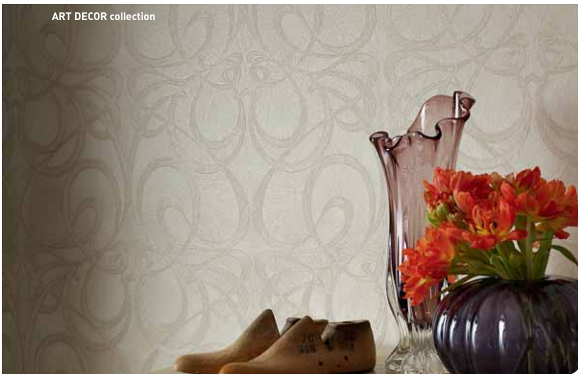
ART DECOR collection